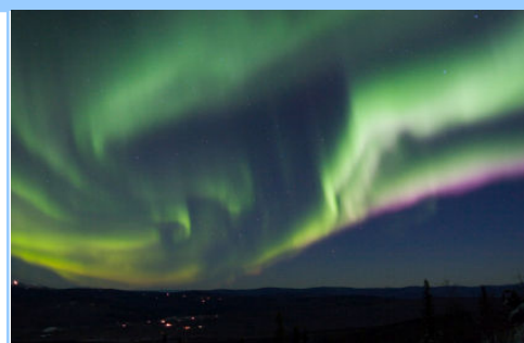
除在午夜太陽時期，在該地區可偶爾看到極光。

巴羅是一個相對細小的地方，但你可以感受到北極圈的風貌，也不用從加拿大西部駕駛七至十天內陸來回。正常郵輪之旅從溫哥華出發，也只能讓你在阿拉斯加州 Juneau 等地方，遙看冰山。